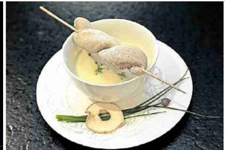
Swiss Tavolata in Eugerswil: Die Gäste geniessen den Apero in der gemütlichen Stube, bevor sie die Thurgauer Spezialitäten kosten. In der Mitte das Hühnerbrüsti, rechts die Süssmostcreme.