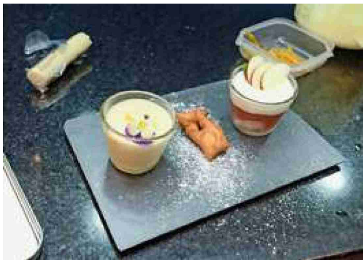
Süsse Versuchung: Gebrannte Creme und Holunderblüten-Apfelmus.