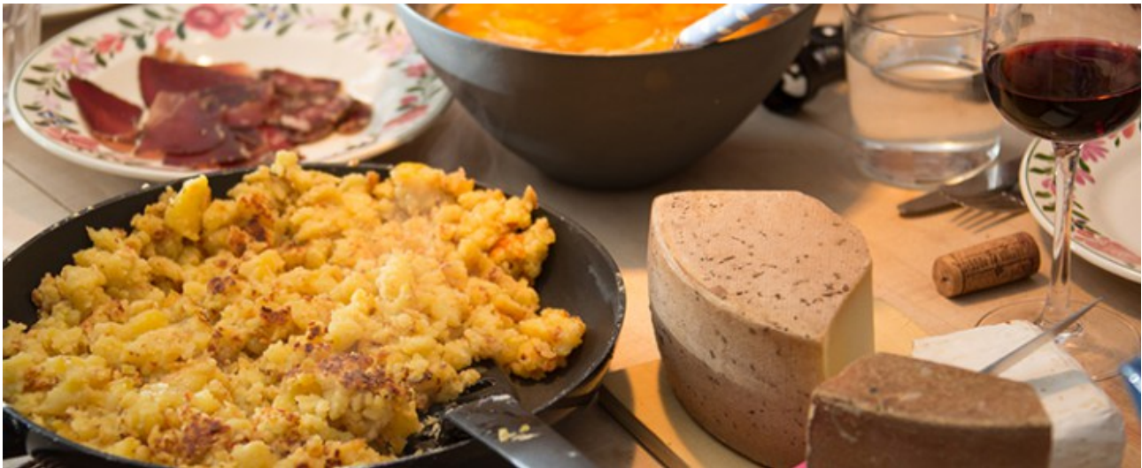
Ein kleiner Auszug aus den Menus

sogar im Tessin kann man ein Essen buchen. Auf der Webseite kann auf einer Karte die Region ausgewählt werden – und wo und wann eine Landfrau ihre Gäste bedient. Auch das Menu kann gleich angesehen werden.