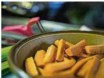
Das Gemüse steht parat.