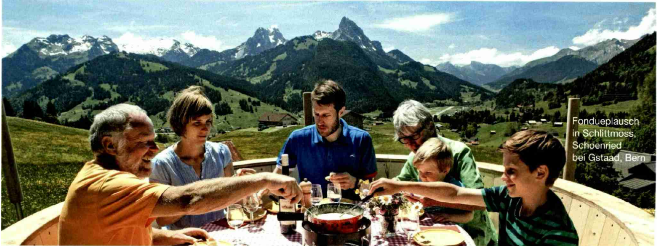
Fondueplausch in Schlittmoss, Schoenried bei Gstaad, Bern