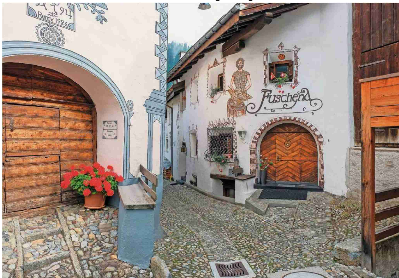
Typische Engadiner Häuser im Dorfkern von Bergün. Da die Romanen es gerne gesellig mochten, haben die Häuser einen grossen, gemeinsamen Eingang.