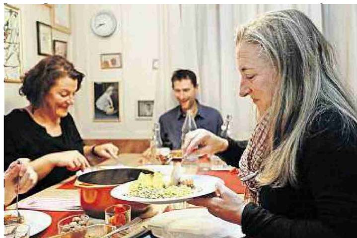
Die Gäste geniessen das Essen und das gemütliche Ambiente.