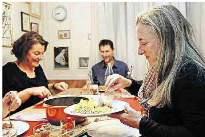
Die Gäste geniessen das Essen und das gemütliche Ambiente.